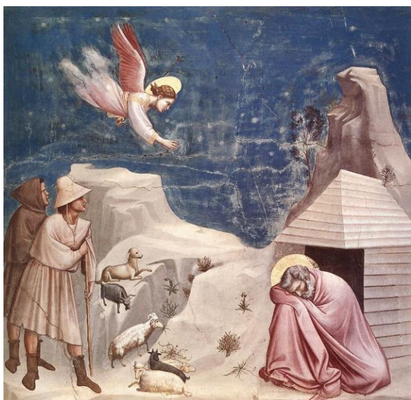
Giotto di Bondone : Le rêve de Joachim

Le Seigneur connaît chacune de nos souffrances actuelles. Il est aux côtés de ceux qui font l’expérience douloureuse d’être mis à l’écart ; notre solitude – aggravée par la pandémie – ne lui est pas indifférente.